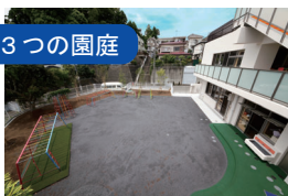
敷地内に3つの園庭