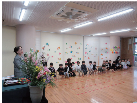
【卒園児紹介】 子供さん達は自分の名前を言えるようになりました。